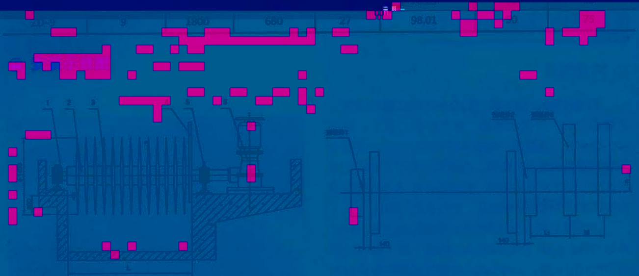
1、轴承座 2、主轴 3、曝气转碟 4、挡水板 5、密封圈 6、驱动装置